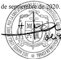
✠ JOSÉ MANUEL LORCA PLANES OBISPO DE CARTAGENA EN ESPAÑA

Dado en Murcia, a 26 de septiembre de 2020.