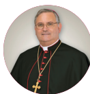
† José Manuel Lorca Planes Obispo de Cartagena